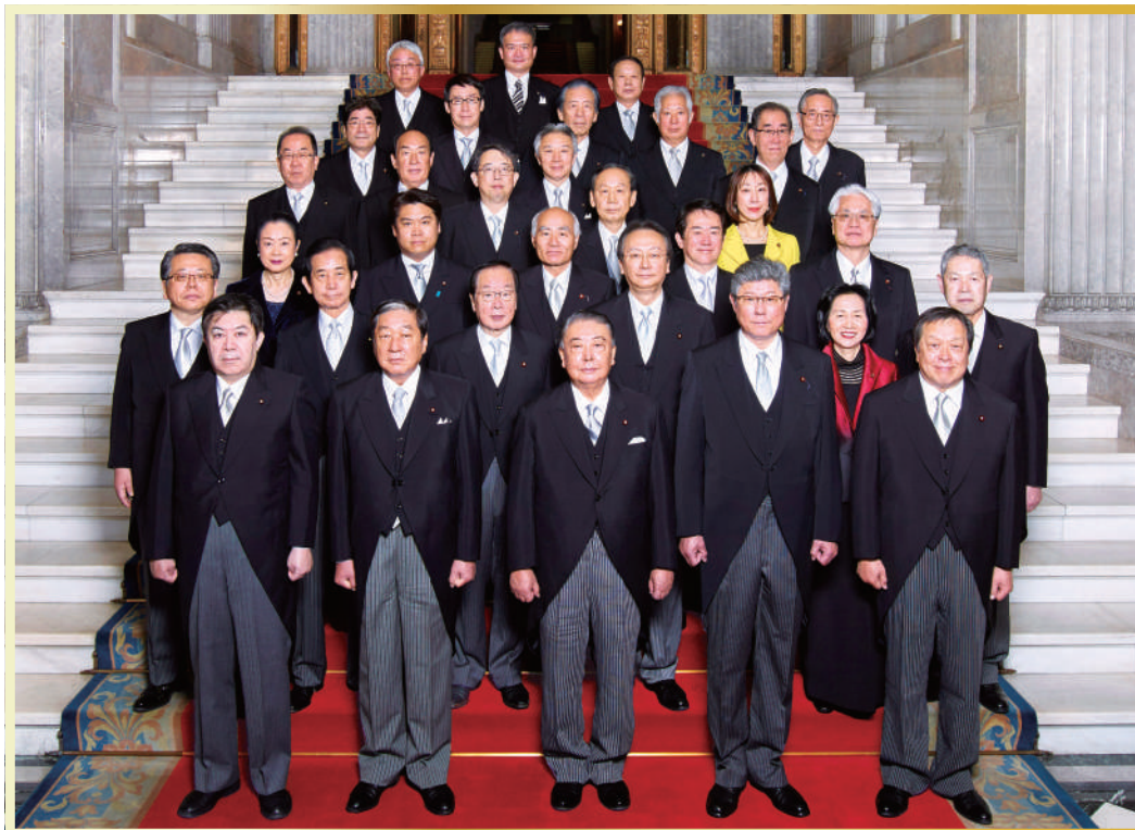
2020年第201回通常国会開会式