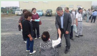
長年のご支援に感謝