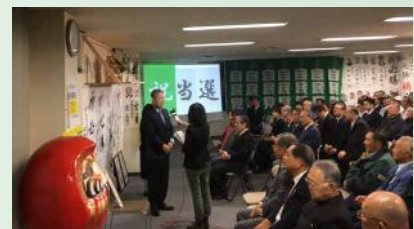
8期目当選直後の風景