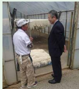
農業について 意見交換