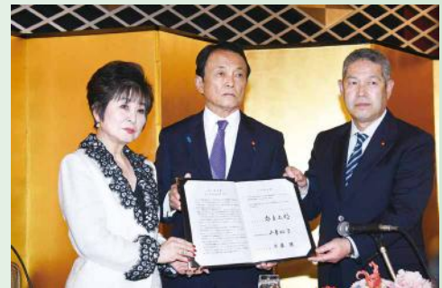
志公会設立の調印式